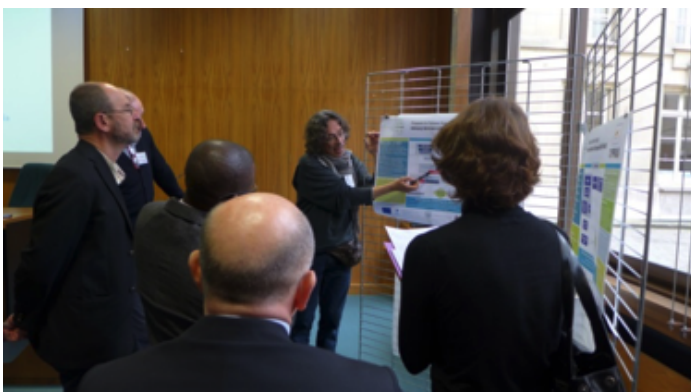
Workshop regional, fotografia tirada pelos parceiros polacos, 2014

“O quadro analítico centrou-se na infraestrutura do AKIS.”