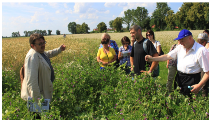
Apresentação realizada durante uma reunião numa exploração de demonstração, fotografia tirada pelos parceiros polacos, 2014