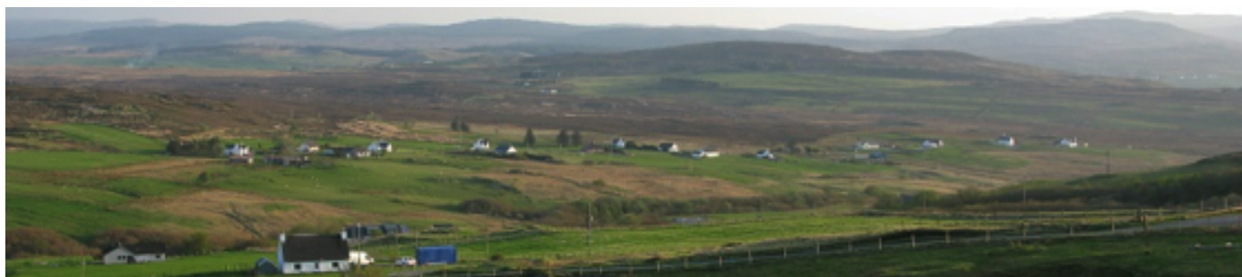
Paisagem típica do crofting , costa oeste da Escócia, fotografia tirada pelos parceiros escoceses, 2014