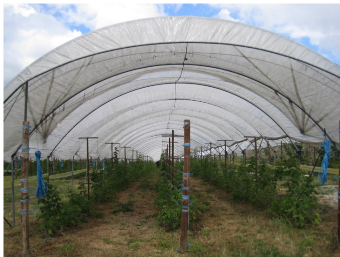
Plantas de pequenos frutos, fotografia tirada pelos parceiros portugueses, 2014

“As redes de inovação não podem ser usadas para substituir o investimento necessário nas infraestruturas de conhecimento e de aconselhamento agrícola.”