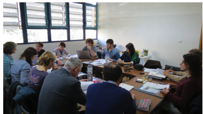
Reunião do Comité de Direção do PRO AKIS, 2014